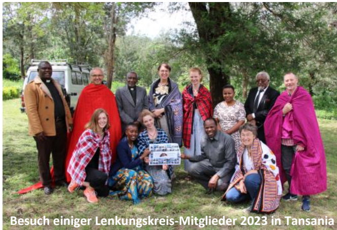
Besuch einiger Lenkungskreis-Mitglieder 2023 in Tansania

Seit genau 40 Jahren gibt es zwischen dem Dekanaten Uffenheim und Massai Nord intensiven Kontakt und partnerschaftliche Beziehungen. Diese werden vor allem durch gemeinsame Projekte und Begegnungen lebendig gehalten.