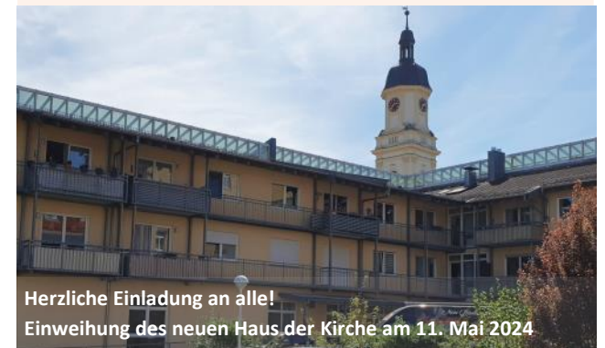
Herzliche Einladung an alle! Einweihung des neuen Haus der Kirche am 11. Mai 2024

Orange: Bildungsveranstaltungen | Anmeldung im Dekanat Grün: Herzliche Einladung zu Gottesdiensten & Andachten Lila: Exkursionen - Teilnahmemöglichkeit bitte erfragen! Grau: Termine für ausgewählten Personenkreis