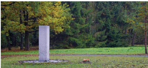
Beispielfoto einer Friedwiese mit Stele

Der Auftrag für die Stele wurde vergeben, der Kirchenvorstand wird sich bei der beauftragten Firma um dessen zeitnahe Ausführung bemühen.